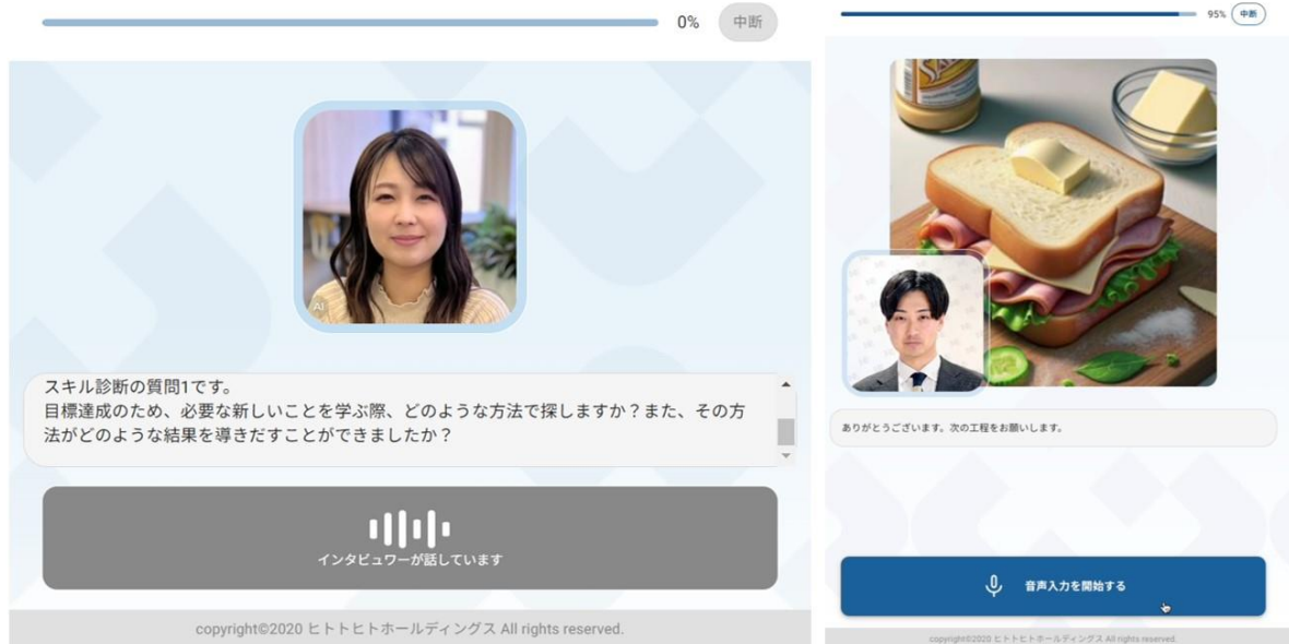
生成 AI とアバターを活用した会話形式のスキル診断