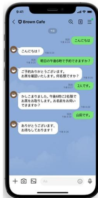
LINE 連携により、アクティブなコミュニケーションを実現